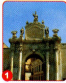
1. PORTA RUDIAE ACCADEMIA DI BELLE ARTI