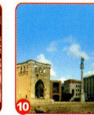
10. PIAZZA S. ORONZO SINESE COLONNA DI S. ORONZO