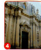
4. CHIESA DI SANTA TERESA