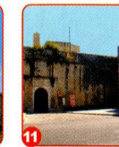
11. CASTELLO DI CARLO V