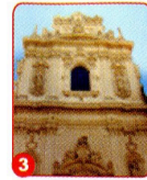
3. CHIESA DELLA MADONNA DEL CARMINE