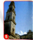
5. PIAZZA DUOMO / CATTEDRALE