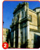
2. BASILICA DI S. GIOVANNI BATTISTA O DEL ROSARIO