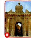
8. PORTA S. BIAGIO