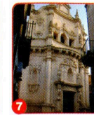
7. CHIESA DI S. MATTEO